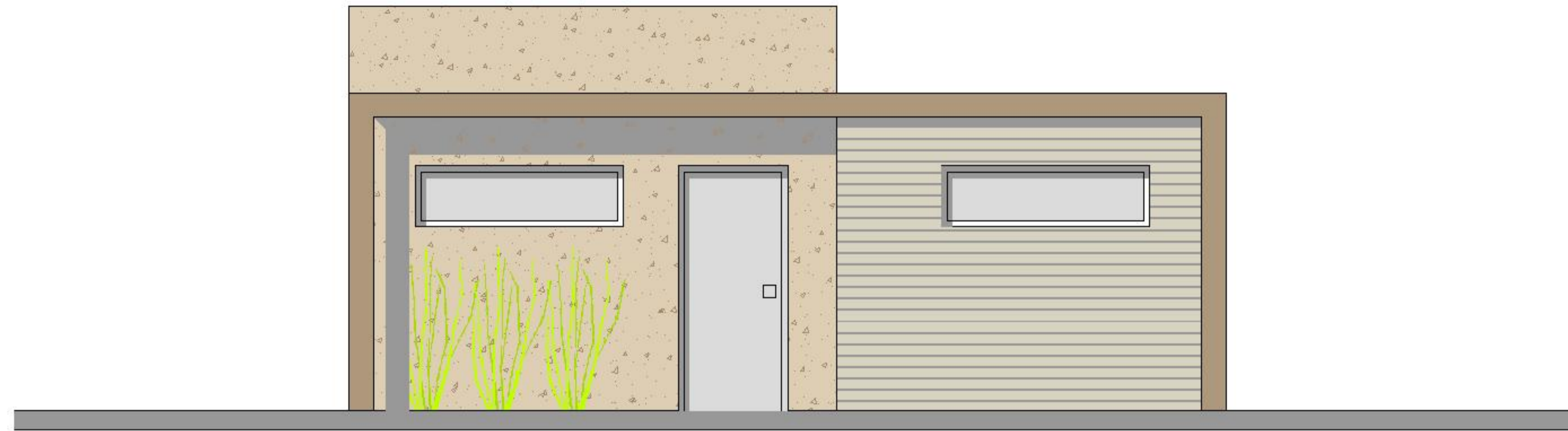
Alzada lateral. Esc. 1:100